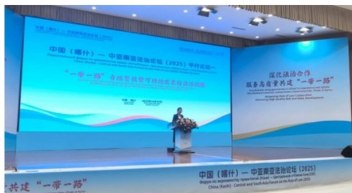
中亚区域经济合作学院学者出席中国（喀什）-中亚南亚法治论坛（2025）