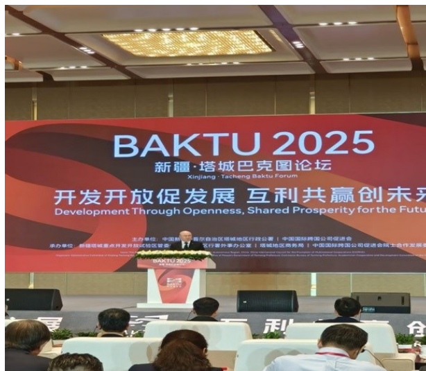
沙利耶夫院长在会议期间进行发言