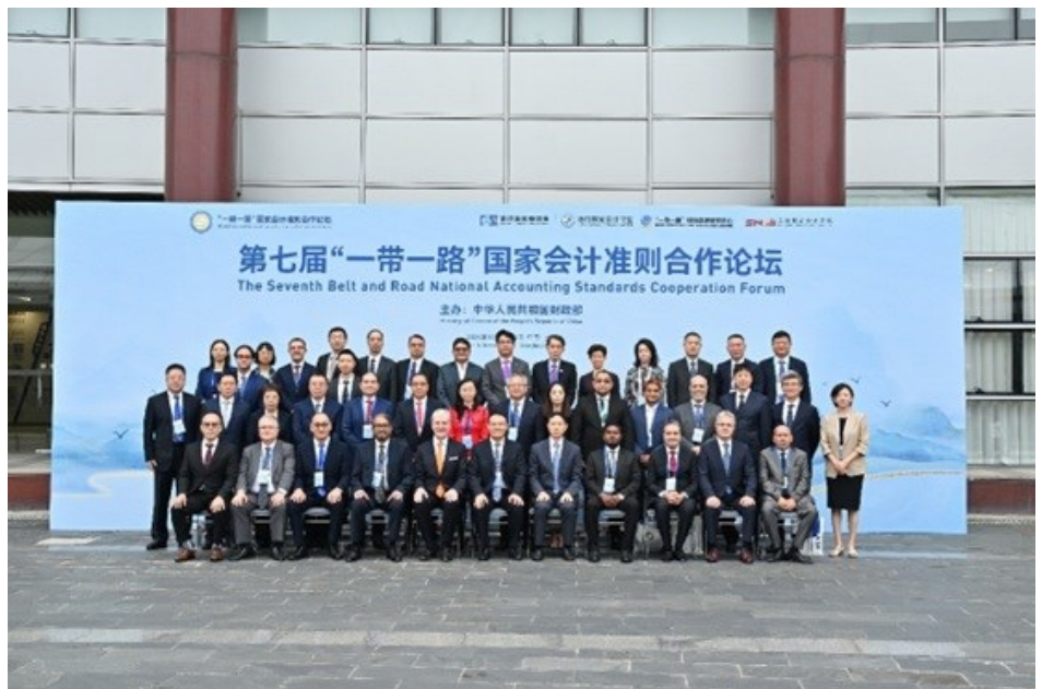
第七届“一带一路”国家会计准则合作论坛参会代表合照

中亚学院此次参与活动，体现了其在推动区域会计准则协调与可持续发展方面的积极作用，以及持续深化知识共享与务实合作的持续努力。