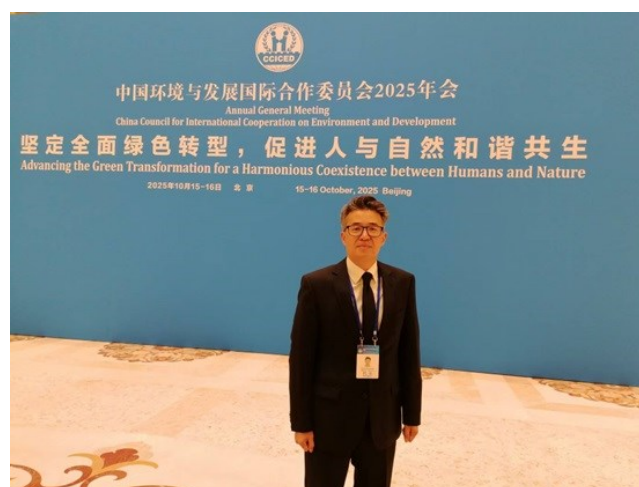
库亚特·阿基扎诺夫博士出席中国环境与发展国际合作委员会2025年年会

中亚学院积极参与此次高级别国际会议，充分展现了其在推动绿色发展战略、促进区域协同发展方面的坚定承诺与务实角色。