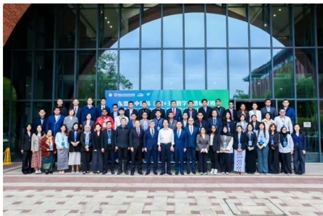
Групповое фото с семинара по цифровой экономике в г. Ханчжоу

Институт ЦАРЭС принял участие в семинарах «АСЕАН плюс три (10+3) по цифровой экономике» и «Третьем семинаре АСЕАН-Китай (10+1) по цифровой экономике» , которые прошли в Чжэцзянском университете в г. Ханчжоу (Китай) с 20 октября по 6 ноября 2025 года. Мероприятие было организовано Центром международных исследований в области развития и управления (CiSDG) Чжэцзянского университета и привлекло более 50 участников из 13 стран.