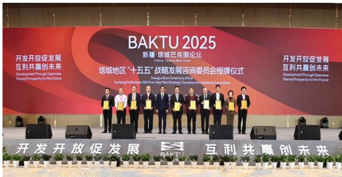
Групповое фото членов Консультативного комитета по стратегическому развитию 15-го пятилетнего плана Таченга