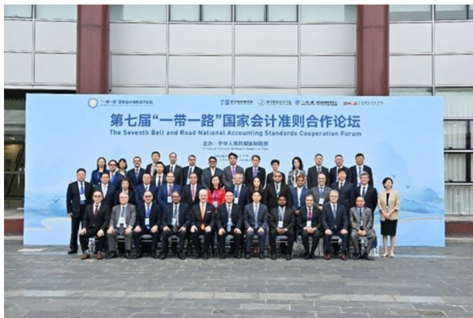
Групповое фото Седьмого форума по сотрудничеству в области национальных стандартов бухгалтерского учета в рамках инициативы «Один пояс, один путь»

Участие Института ЦАРЭС подчеркивает его приверженность региональному сотрудничеству и обмену знаниями в поддержку продвижения стандартов бухгалтерского учета и устойчивого развития.