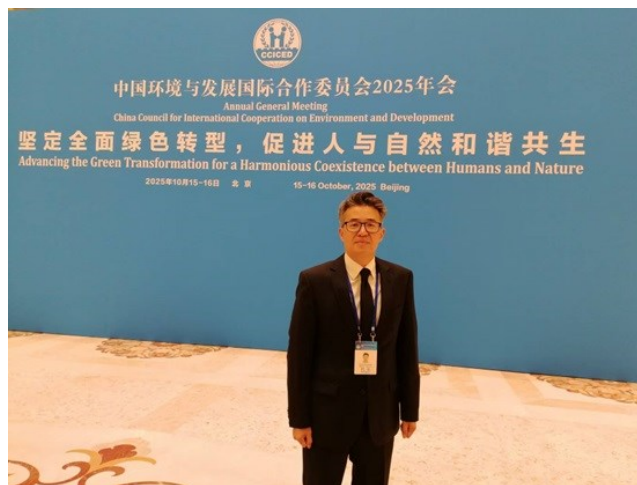
Д-р Куат Акижанов на Ежегодном общем собрании CCICED 2025 г.

Доктор Акижанов принял участие в качестве эксперта в двух форумах: «Зеленый и справедливый переход: создание нового двигателя экономического и социального развития» и «Преодоление ограничений линейной экономики: построение новой циркулярной экономики» . В ходе обсуждений он подчеркнул важность согласования энергетического перехода в Центральной Азии с социальной справедливостью, особо отметив необходимость обеспечения энергетической безопасности, равенства и инклюзивного роста в регионе. Он также отметил, что принятие принципов циклической экономики может значительно сократить потребление ресурсов и создать новые возможности для зеленой занятости. Опираясь на опыт Китая в продвижении политики циклической экономики, д-р Акижанов также призвал к расширению регионального сотрудничества посредством инноваций, зеленого финансирования и обмена знаниями.