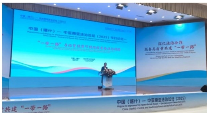
Фотоколлекция с Китайского (Каши) форума по верховенству права в Центральной и Южной Азии 2025 г.