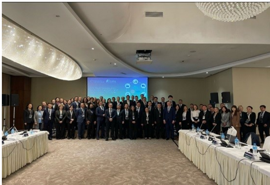
Групповое фото с диалога SIPA

11-12 марта 2025 года в г. Алматы, Казахстан, состоялся диалог по вопросам разработки политики SIPA по устойчивым и жизнеспособным грузовым перевозкам в Центральной Азии. Организаторами мероприятия выступили Международный транспортный форум (МТФ), Министерство транспорта Казахстана, Международная климатическая инициатива (МКИ), Организация экономического сотрудничества и развития (ОЭСР) и Экономическая комиссия ООН для Азии и Тихого океана (ЭСКАТО). В нем приняли участие высокопоставленные государственные служащие из стран Центральной Азии, а также представители и отраслевые эксперты из таких международных организаций, как Всемирный банк, Азиатский банк развития, Институт ЦАРЭС и др.