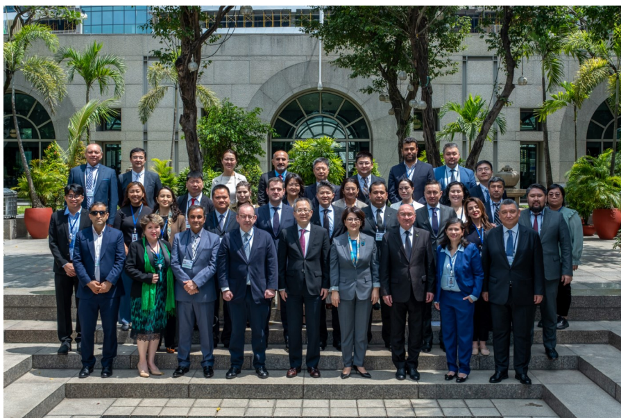
Групповое фото с заседания по стратегическому планированию НК ЦАРЭС