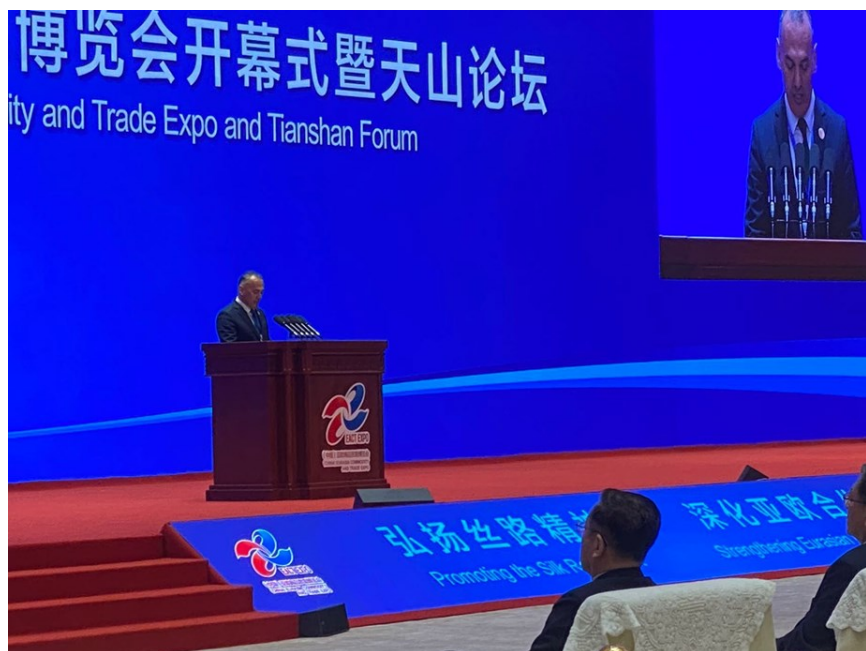
中亚学院院长卡比尔·朱拉佐达2023（中国）亚欧商品贸易博览会开幕式暨天山论坛上发言

2023年是共建“一带一路”倡议提出10周年。此外，首届中国—中亚峰会也于今年在中国陕西省西安市成功举行。这些都为区域经济合作带来了新的发展契机。中亚学院将与CAREC成员国保持密切合作，通过开展联合研究、政策对话、知识共享网络研讨会、能力建设等方式，促进CAREC机制和“一带一路”倡议的有效对接。