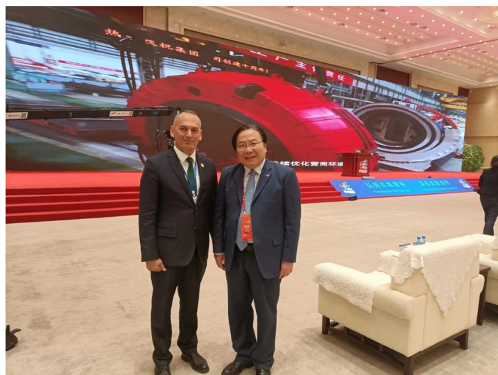
会见中国进出口银行副行长张文才