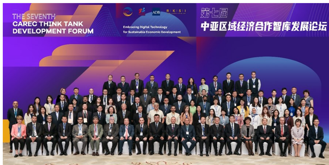
第七届中亚区域经济合作智库发展论坛参会嘉宾合照