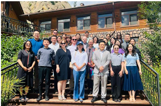
中亚学院参与蒙古国产业政策研讨会

参会者还就工业多元化、新兴部门和中小企业发展等方面的国际最佳政策实践进行了探讨。会上，韩国产业经济和贸易研究所的专家分享了韩国发展经验。此外，研讨会还介绍了联合国工业发展组织基于实证的产业政策制定和提高工业政策质量的工具包，参会者在其中学习了如何制定现有的产业政策，识别政策差距、重复、遗漏等，并结合其他国家的最佳做法，进一步改善工业政策。