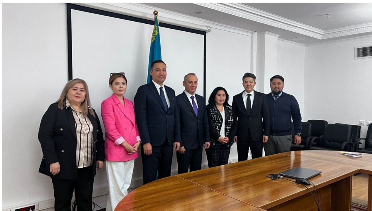
与CAREC哈萨克斯坦国别联络人进行会晤

此外，双方就即将举行的CAREC部长级会议、中亚学院理事会和咨询委员会等议题进行了深入讨论。