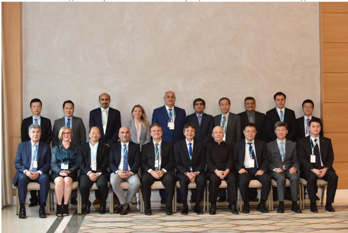
Фото 2: Участники заседания Консультативного совета Института ЦАРЭС в г. Ташкенте в июне 2019 года.