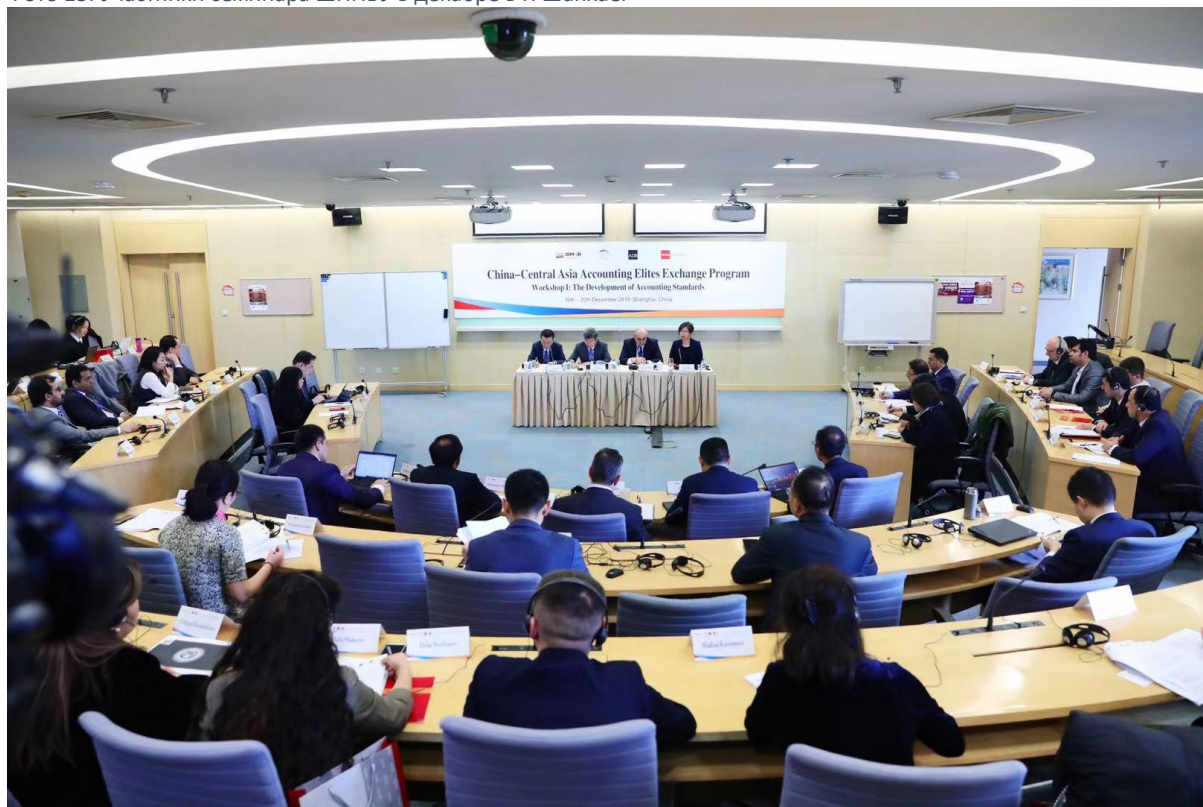
Фото 13: Участники семинара ШНИБУ в декабре в г. Шанхае.

Институт ЦАРЭС и Шанхайский Национальный институт бухгалтерского учета (ШНИБУ) КНР в партнерстве с Ассоциацией дипломированных сертифицированных бухгалтеров (АССА) 16 декабря 2019 года запустили программу наращивания потенциала и обмена знаниями под названием «Программа обмена бухгалтерскими дарованиями Китая и Центральной Азии».