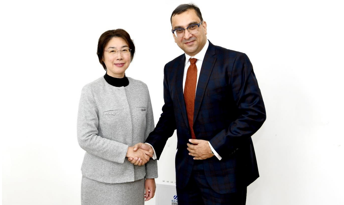
Фото 3: Заместитель министра финансов КНР г-жа Цзоу Цзяи и директор Института ЦАРЭС г-н Сайед Шакил Шах в Пекине

Переговоры в Пекине были сосредоточены на создании механизма консультаций и исследований. Институту было предложено несколько тем для семинаров, таких как управление долгом и устойчивость в рамках системы управления долгом, разработанной Министерством финансов и МВФ; подготовка инфраструктурных проектов, оценка рисков, соблюдение требований, экологические гарантии и доступ к фондам АБИИ для финансирования проектов. Исследования восприятия различных региональных инициатив,