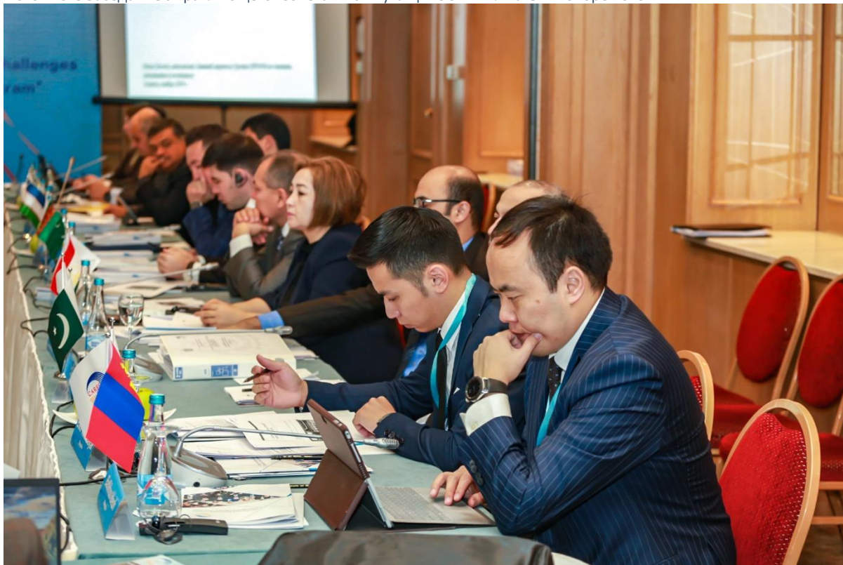
Фото 1: 9-е Заседание Управляющего Совета Института ЦАРЭС в г. Алматы в ноябре 2019 г.

Девятый Управляющий Совет (УС) Института ЦАРЭС состоялся 28 ноября 2019 года в г. Алматы, Казахстан. Совет, как надзорный и высший директивный орган Института, обсудил материалы восьмого Заседания УС, Отчет о ходе работы Института за 2019 год, программу и план работы на 2020 год, приоритеты, план найма, бюджет и вопросы финансирования, рекомендации второго Заседания Консультативного совета, состоявшегося в июне 2019 года, процесс получения Институтом статуса наблюдателя ООН, партнерство внутри ЦАРЭС с другими региональными инициативами и др.