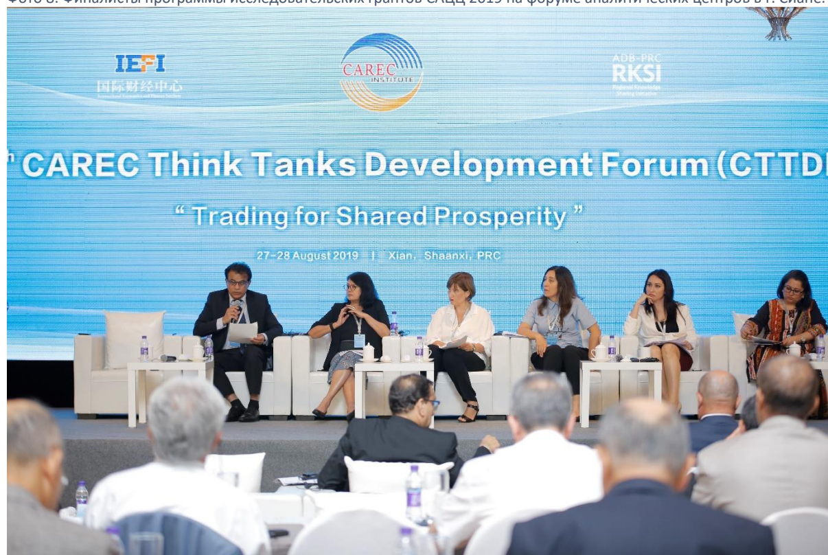
Фото 8: Финалисты программы исследовательских грантов САЦЦ 2019 на форуме аналитических центров в г. Сиане.

В рамках сети аналитических центров ЦАРЭС (САЦЦ) в мае 2019 года Институт ЦАРЭС запустил программу исследовательских грантов для поддержки ученых и исследователей из стран-членов САЦЦ в разработке целевых продуктов знаний, которые будут дополнять совокупность знаний о региональном сотрудничестве в ЦАРЭС.