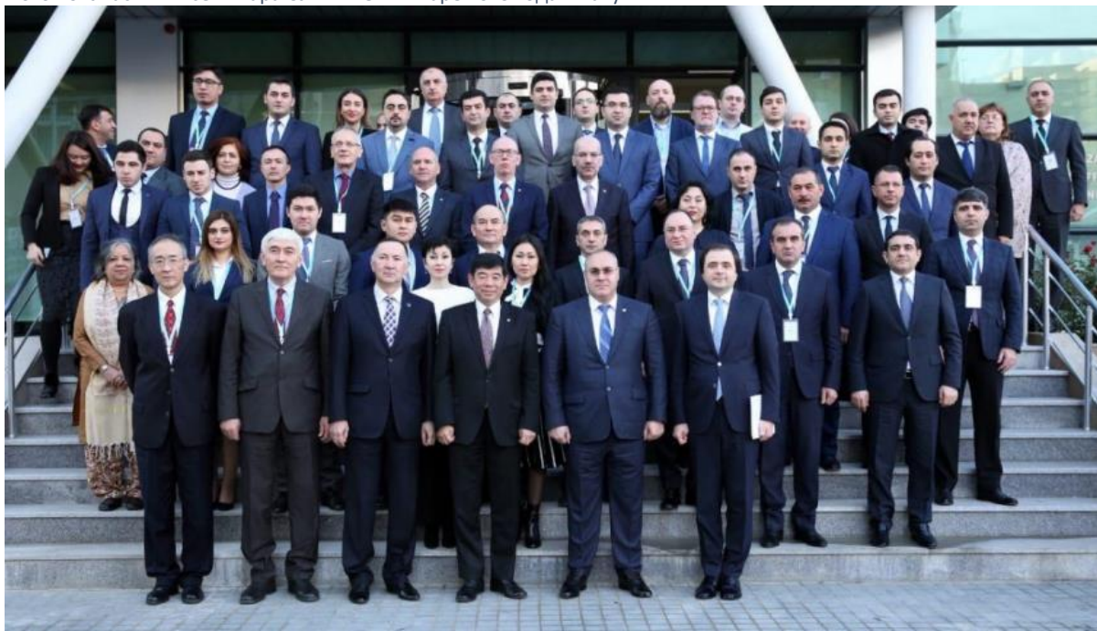
Фото 10: Участники семинара СУПТ ВТО в январе 2019 года в Баку.

При участии делегатов от государственных таможенных и налоговых служб стран-участниц ЦАРЭС, а также экспертов из Всемирной торговой организации (ВТО), Всемирной таможенной организации, ЮНКТАД, Главного управления таможенной службы Китая и Азиатского банка развития Институт ЦАРЭС 15-16 января 2019 года организовал семинар по реализации Соглашения ВТО по Упрощению процедур торговли (СУПТ) в г. Баку, Азербайджан,