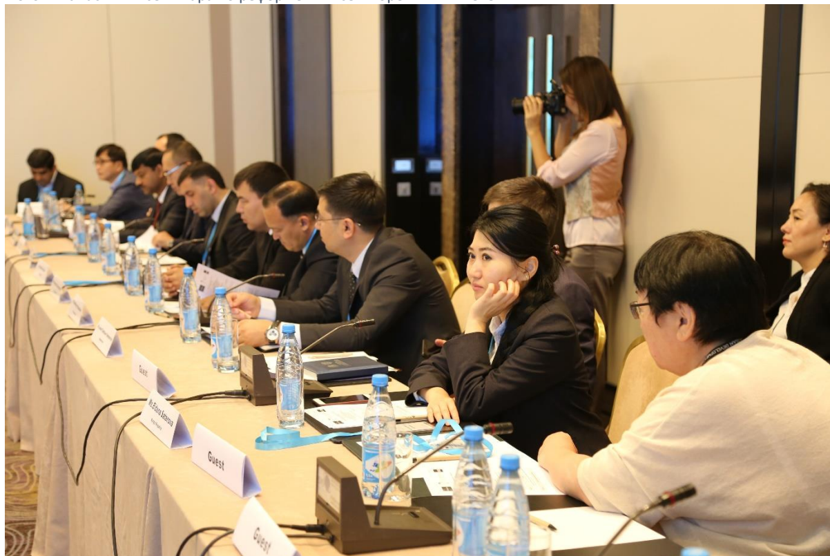
Фото 12: Участники семинара по реформе ГП в сентябре в г. Бишкеке.

В сотрудничестве с АБР и Американским университетом в Центральной Азии Институт ЦАРЭС 26-27 сентября 2019 года в г. Бишкеке, Кыргызстан организовал семинар для руководящих работников государственных органов, ответственных за управление государственными предприятиями (ГП) и государственно-частное партнерство (ГЧП), чтобы обсудить существующие практики ГП и стратегии реформ.