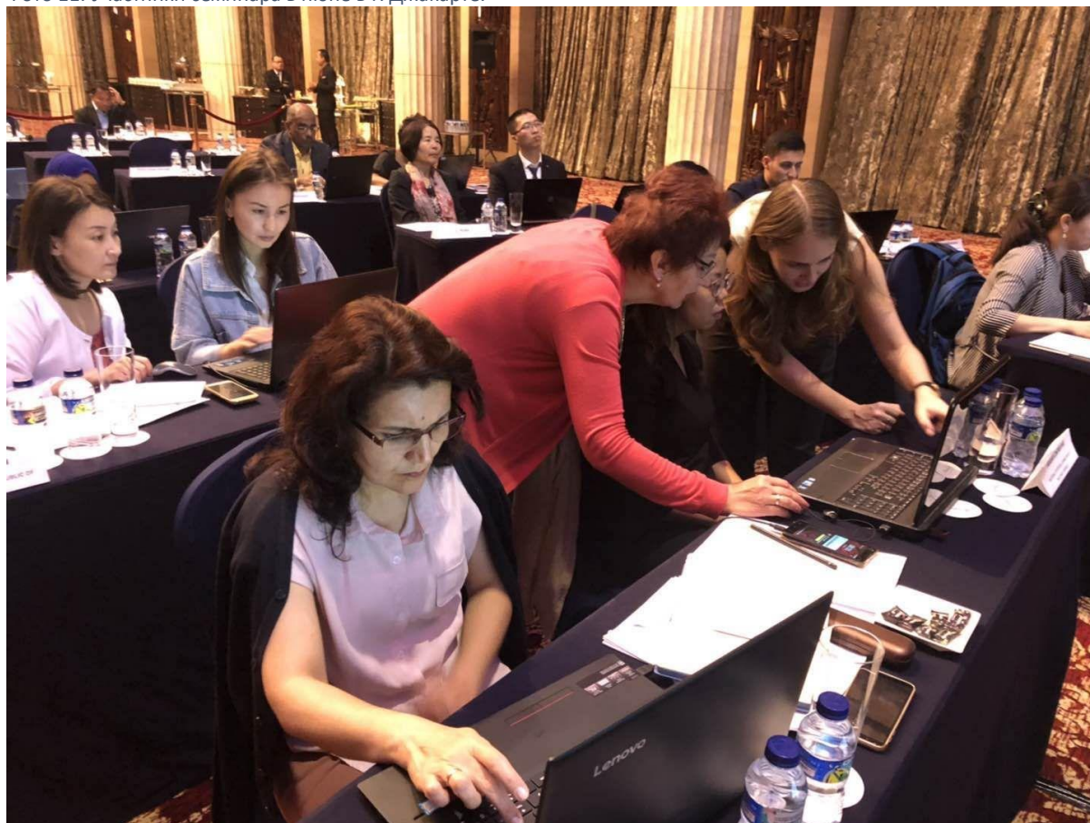
Фото 11: Участники семинара в июне в г. Джакарте.

С целью устранения критических пробелов в показателях и аналитических пробелов в экономических информационных системах региона ЦАРЭС Институт ЦАРЭС организовал семинар по статистике экономической глобализации в партнерстве с АБР и Исламским банком развития (ИБР), а также конференцию по составлению карт цепочек добавленной стоимости, которая состоялась 10-15 июня 2019 года в г. Джакарте, Индонезия.